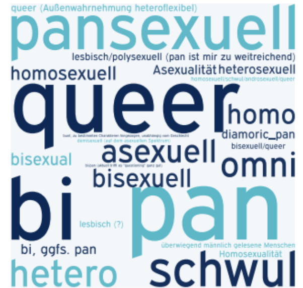
Abbildung 5 Sexuelle Orientierungen, qualitatives Teilprojekt